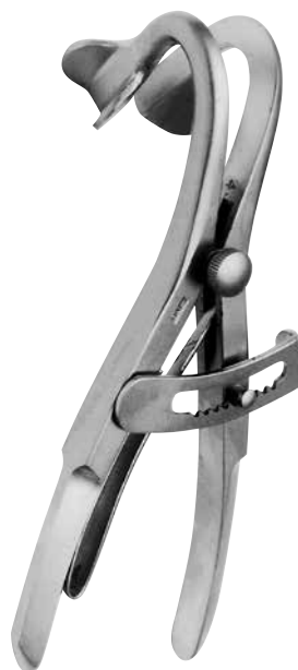
デンハルト開口器