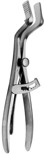
ローゼルケーニッヒ開口器