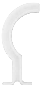
バーマンエアウェイ