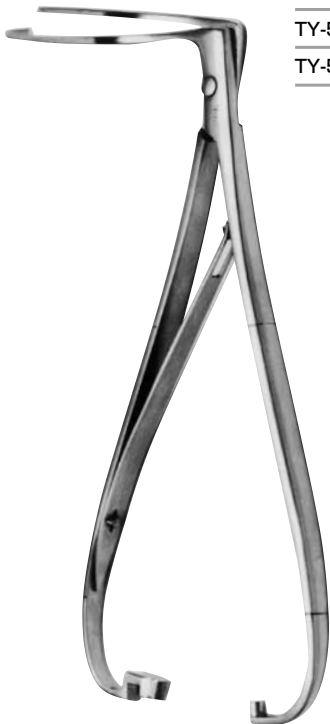
クレブランド結紮輸送器