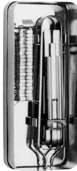
キーファ自動縫合器 キーファクレンメ