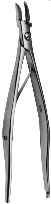
ミヘル縫合及び除去鉗子